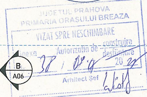
FATADA C 1